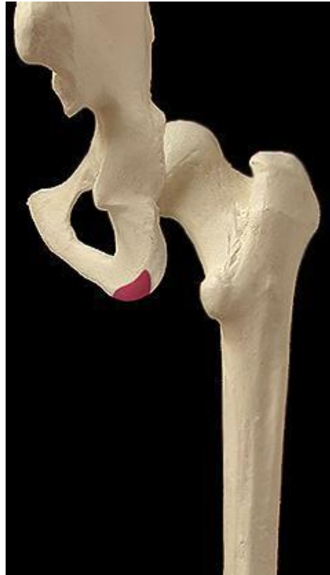
LE JEUNE AURELIEN